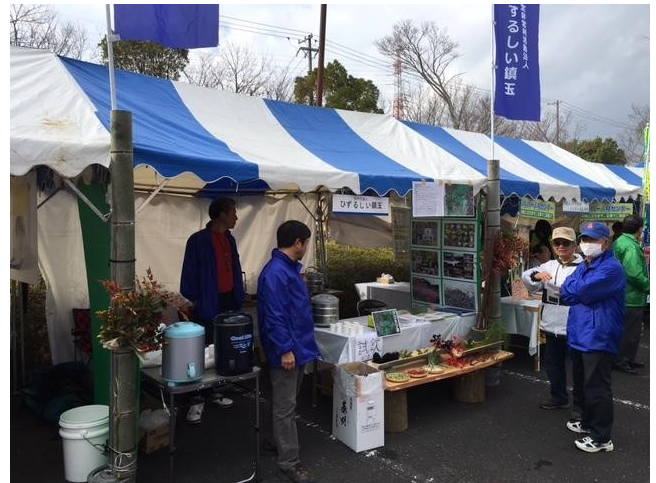
北区Deまつり2016に出展@都田総合公園