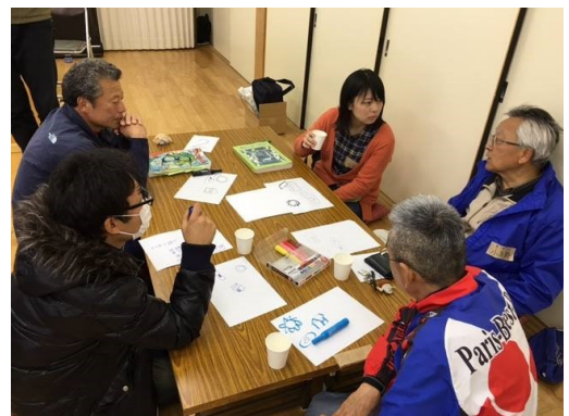
グループワークの様子

次回は5月28日、29日の二日間にわたり、地域のあるもの探しから、環境教育プログラムに使える要素を拾い出していく予定です。