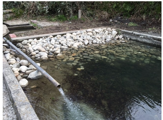
【川】 ビオトープづくり@旧田沢小学校プール